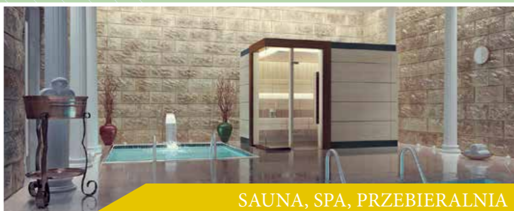
SAUNA, SPA, PRZEBIERALNIA

GOTOWY DO UŻYCIA ŚRODEK CZYSZCZĄCY, SZYBKO PARUJĄCY. NIE WYMAGA SPŁUKIWANIA. DO CODZIENNYCH PORZĄDKÓW.